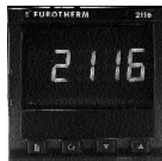
Modèle 2116i 48 x 48mm (1/16 DIN)